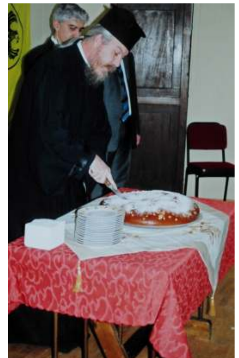
Στην κοπή βασιλόπιτας του Συλλόγου μας