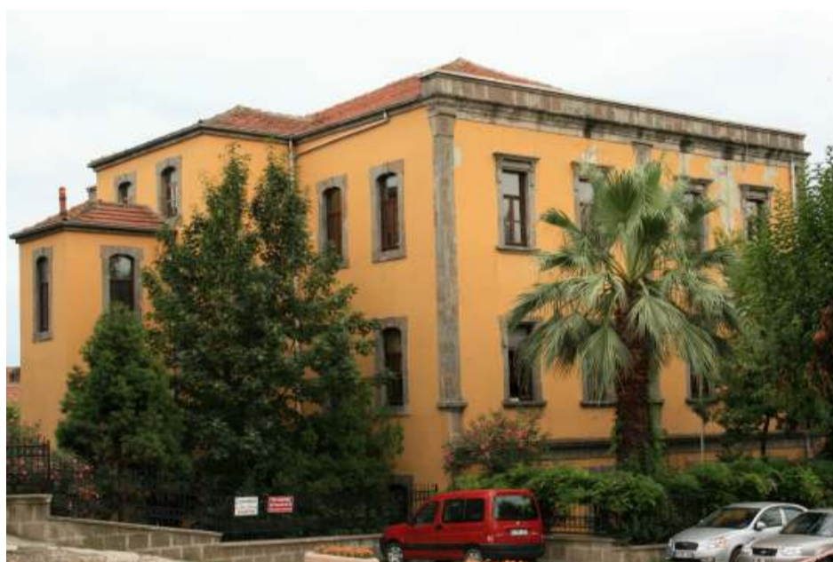
ΠΑΝΕΠΙΣΤΗΜΙΟ ΜΑΥΡΗΣ ΘΑΛΑΣΣΑΣ

στιές τους. Υπάρχει μάλιστα και τηλεοπτικό μουσικό κανάλι Μαβί Καραντενίζ που παρουσιάζει αποκλειστικά βιντεοκλίπ τουρκόφωνων ποντιακών τραγουδιών!!! Από το Μείντάν ξεκινούν οι πιο σημαντικοί εμπορικοί οδοί της πόλης, το Ουζούν Σοκάν, η Καχηραμανμάρ καντεσι και η Κουντουρατσιλαρ που φθάνει μέχρι την Μπεντέστεν Σοκακ. Οι τρεις αυτοί παράλληλοι δρόμοι αντιπροσωπεύουν τα διάφορα κοινωνικά στρώματα της πόλης. Ο πρώτος δρόμος, το Ουζούν Σοκάν είναι γεμάτος με ταχυφαγεία και εμπορικά καταστήματα και αποτελεί τον αγαπημένο πεζόδρομο της νεολαίας και των τούρκων που ακολουθούν το δυτικό τρόπο ζωής. Στον επισκέπτη κάνει εντύπωση ότι είναι ο συγκεκριμένος δρόμος είναι μονίμως στολισμένος με σημαίες χρώματος μπλε και βυσσινί στα χρώματα δηλαδή της τοπικής ποδοσφαιρικής ομάδας Τραμπζονσπόρ η οποία