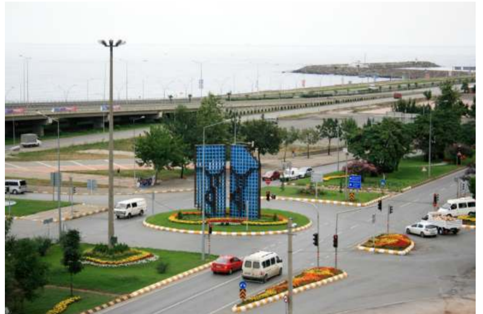
Άγαλμα χορευτών Σέρρας σε πλατεία

Η πρώτη γνωριμία του σημερινού επισκεπτή με την πόλη είναι το αεροδρόμιο της , κτισμένο στα ανατολικά της πόλης και κυριολεκτικά πάνω στο γκρεμό και δίπλα από τη κύμα . Μέχρι τον επέκταση των αεροδιαδρόμων του μέσα στη θάλασσα θεωρούνταν από τα δυσκολό-