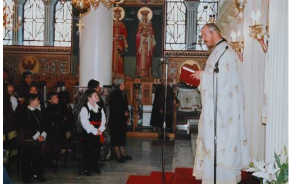
Την ώρα του κυρήγματος του Ευαγγελία

εις πέρας με το καλύτερο αποτέλεσμα. Τη συμπεριφορά του την χαρακτήριζε μια αξιοπρέπεια που σε έκανε να τον σέβεσαι και συνάμα μια απλότητα που σε έκανε να τον νιώθεις πρόσωπο οικείο. Επίσης τον χαρακτήριζε ο αυτοσεβασμός, η ειλικρίνεια και η συνέπεια λόγων και έργων γεγονός που ενίσχυε τον σεβασμό των άλλων στο πρόσωπο του. Το γέλιο και το χαμόγελο δεν έλλειψε ποτέ από το πρόσωπό του. Ένα πρόσωπο ειρηνικό, ήρεμο, ανυπόκριτο, γεμάτο θάρρος και παρρησία. Μιλούσε με σύνεση για το καθετί όποτε και αν συνέβαινε αυτό, στο κήρυγμα, στην παρέα, στο σχολείο, στα παιδιά, στην κατασκήνωση. Τα λόγια του σου έδιναν δύναμη, θάρρος κι ελπίδα για τη ζωή. Δίδασκε με έναν τρόπο κυρίως βιωματικό έτσι που να σου δείχνει πιο