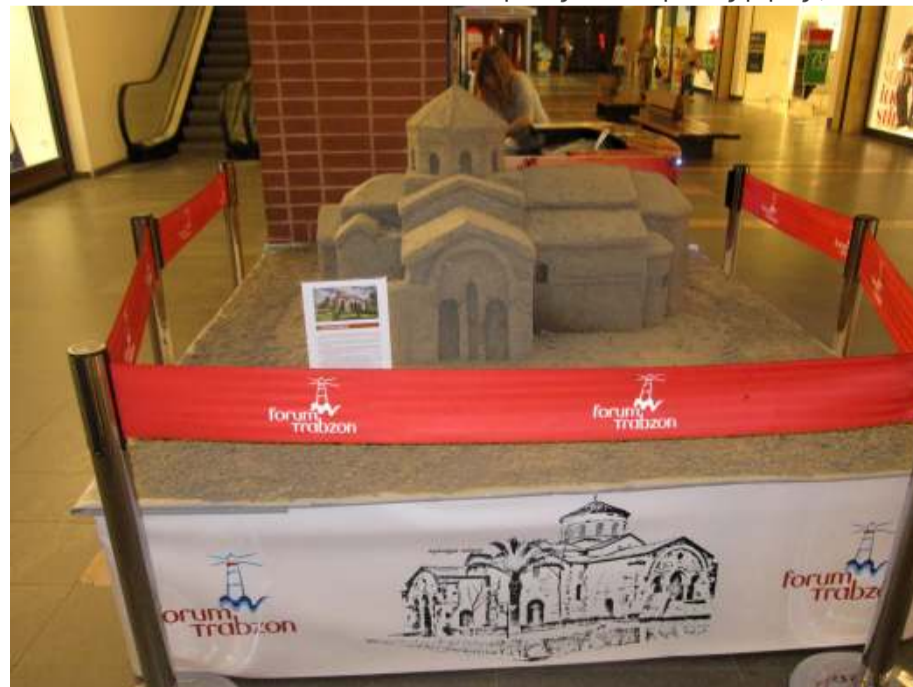
forum Trabzon ΑΓΙΑ ΣΟΦΙΑ