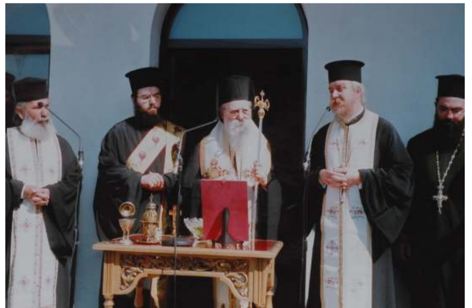
Από τα εγκαίνια της αίθουσας μνημοσύνων

Η ευγένεια του προσώπου του φανέρωνε την ευγένεια και την καλοσύνη της ψυχής του (ο λύχνος του σώματος εστί ο οφθαλμός Λκ, ια 34). Η αγαθότητα και η αγάπη πλημμύριζαν την ψυχή του και χαρακτήριζαν τις πράξεις του. Φάρος της ζωής του ήταν η αλήθεια, η ελπίδα και κατά βάση ο ίδιος ο Χριστός. Ήταν άγιος για όλα, και ό,τι ανέλαβε ή του ανατέθηκε το έφερε