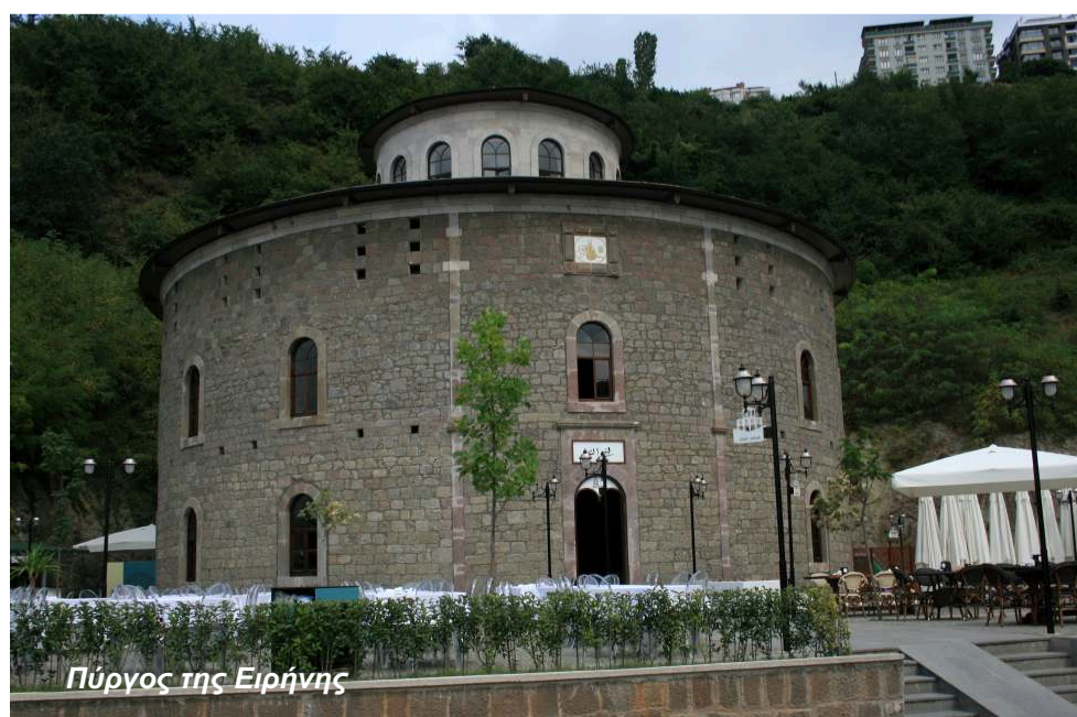
Πύργος της Ειρήνης