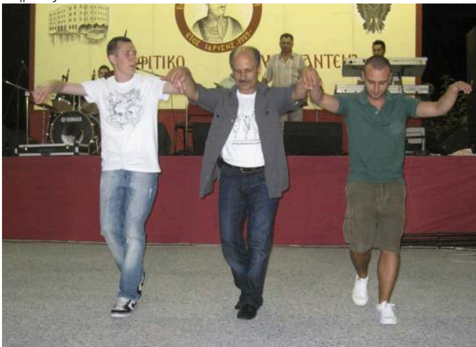
Οι εκ Πόντου επισκέπτες στον χορό "Σέρρα"