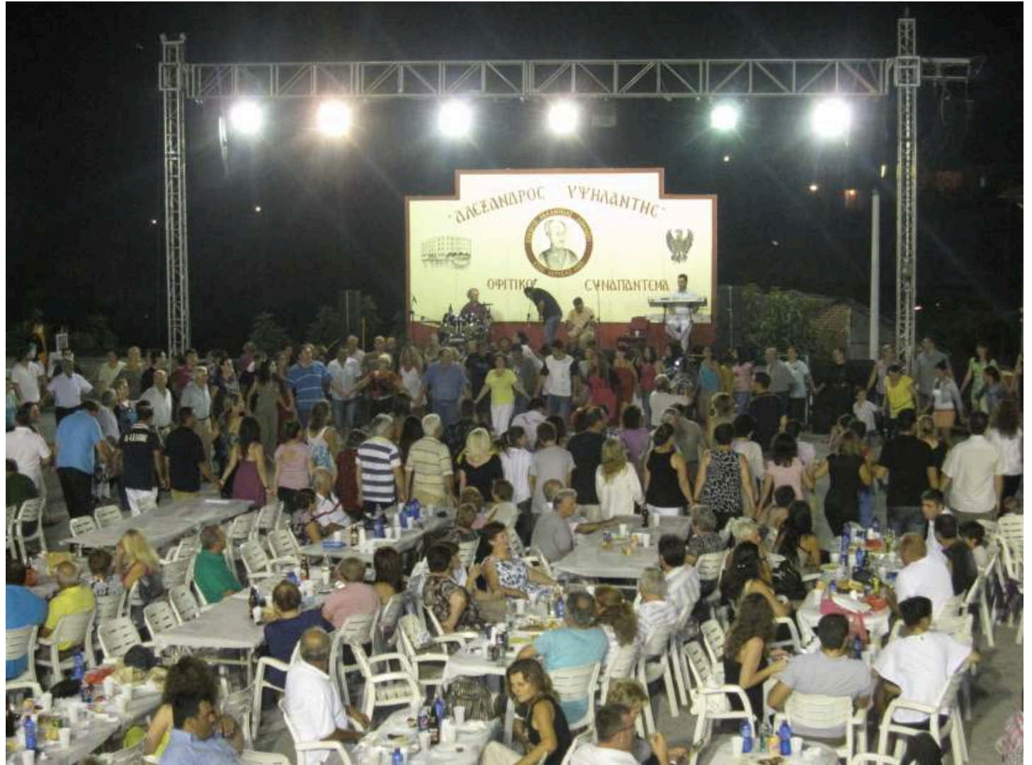
Άποψη του κόσμου που συμμετείχε στο Οφίτικο Συναπάντημα

Το Δ.Σ του Συλλόγου ευχαριστεί θερμά τους χορηγούς, και τους εθελοντές οι οποίοι με την εργασία τους συνέβαλαν τα μέγιστα για την άψογη διοργάνωση του Οφίτικου Συναπαντήματος.