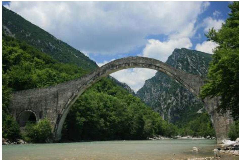
ΓΕΦΥΡΙ ΠΛΑΚΑΣ - ΤΖΟΥΜΕΡΚΑ

ποτάμι, εκεί που θα τελειώνει το γεφύρι. Έπρεπε να βρει μέρος που να συνδυάζει ορισμένες απαραίτητες προϋποθέσεις. Και πρώτα – πρώτα, στο σημείο εκείνο έπρεπε να πλησιάζουν οι όχθες η μια προς την άλλη, ώστε αν ήταν δυνατόν με μία μόνο καμάρα (τόξο), όσο το δυνατόν μικρότερη, να μπορέσει να τις γεφυρώσει. Από την πείρα τους ήξεραν, ότι όσο μικρότερη ήταν η καμάρα, τόσο πιο στέρεο και το γεφύρι, και είχε και μικρότερο κόστος κατασκευής. Έπρεπε επίσης, εκεί που θα πατούσαν οι βάσεις του, το έδαφος να είναι οι πετρώδες και συμπαγές. Πολλές φορές ο πρωτομάστορας χρειάζονταν να ανεβοκατεβαίνει τις όχθες του ποταμού μέχρι να βρει το κατάλληλο σημείο.