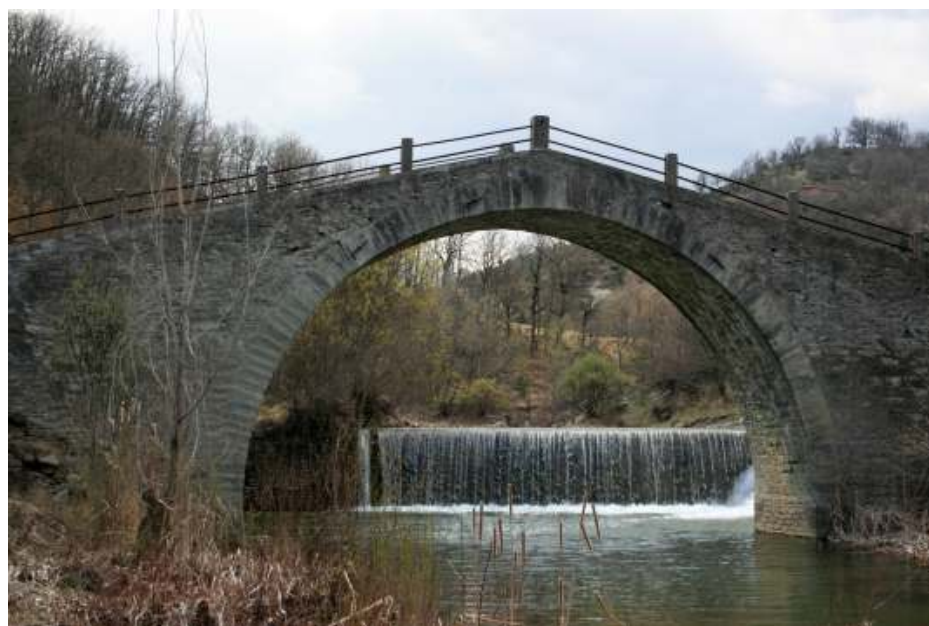
ΓΕΦΥΡΙ ΤΗΣ ΜΑΕΡΗΣ - ΔΑΣΥΛΙΟ ΓΡΕΒΕΝΩΝ

σκληρές πέτρες. Τελειώνοντας με αυτήν την διαδικασία (επιλογής νταμαριού), άρχιζαν αμέσως να διαμορφώνουν το έδαφος, εκεί που θα πατούσαν