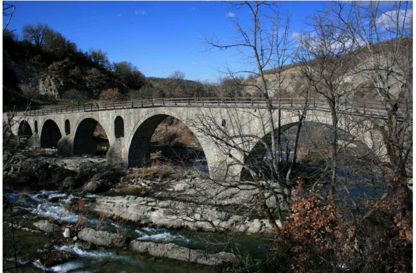
ΓΕΦΥΡΙ ΣΠΑΝΟΥ ΓΡΕΒΕΝΩΝ

Ο πρωτομάστορας του μπουλουκιού επέλεγε το κατάλληλο σημείο στο