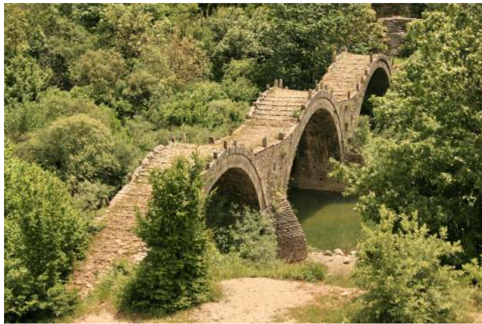
ΚΑΛΟΓΕΡΙΚΟ- ΚΗΠΟΙ ΖΑΓΟΡΙΟΥ

Μετά την ρωμαϊκή εποχή ακολουθεί η βυζαντινή περίοδος και η τουρκοκρατία. Στη διάρκεια αυτών των εποχών επικρατεί ο τύπος του πέτρινου τοξωτού