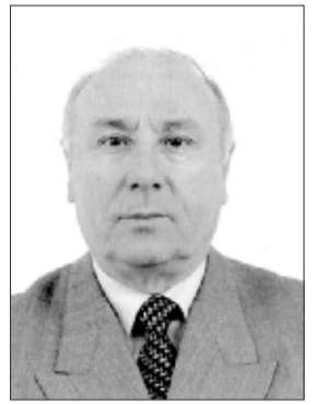
ΤΟΥ ΗΛΙΑ ΣΠΑΝΟΥ

Λόρδος Άκτον (Βρετανός ιστορικός του 19ου αιώνα)