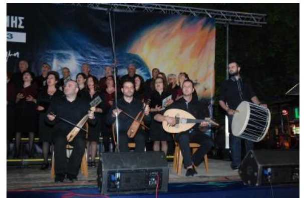
Οι χορωδίες των Ποντιακών Συλλόγων του Νομού.

γος, ιστορικός και αρχαιολόγος, της πόλης μας.