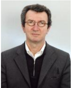
του Γιάννη Μεγαλόπουλου

Συλλογή στοιχείων που προκύπτουν από την μελέτη και αποδελτίωση της Οθωμανικής απογραφής του πληθυσμού της αυτοκρατορίας το 1834.