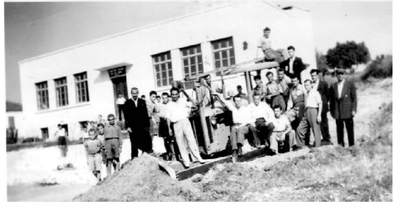
Εργασίες επιχωμάτωσης στην αυλή του Δημοτικού Σχολείου Νέας Τραπεζούντας.