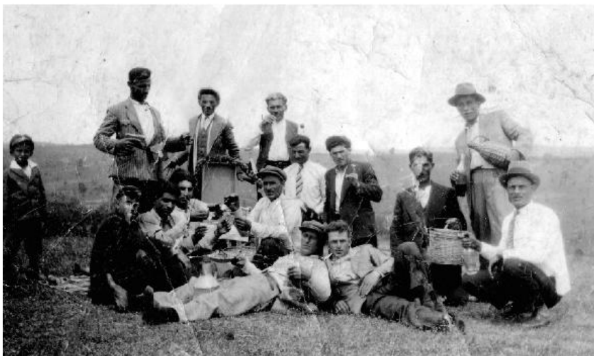
1934: Οφίτες πρώτης γενιάς σε πανηγύρι της Αγίας Τριάδος στον Κάτω Άγιο Ιωάννη.