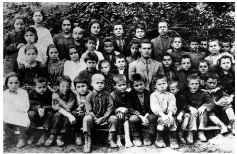
Μαθητές Ελληνικού Σχολείου στη Γάγγρα Ρωσίας μεταξύ των οποίων και πολλά παιδιά καταγόμενα από τον Όφι.