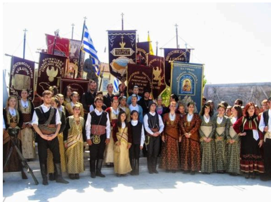
Νέοι και νέες με τα λάβαρα των συλλόγων στο μνημείο που βρίσκεται στην οδό 19ης Μαΐου στην Κατερίνη.

Δεν είναι η πρώτη φορά που οι Σύλλογοί μας διοργανώνουν κοινές εκδηλώσεις και πρωτοτυπούν. Το ξεχωριστό αυτής της εκδήλωσης ήταν ότι για πρώτη φορά στην Ελλάδα παρευρέθη ως ομιλητής, σε εκδήλωση ποντιακών συλλόγων για την γενοκτονία των Ελλήνων του Πόντου, τούρκος ακαδημαϊκός, ο Σαΐτ Τσετίνογλου, γνωστός Ακαδημαϊκός και αγωνιστής των Ανθρωπίνων Δικαιωμάτων.