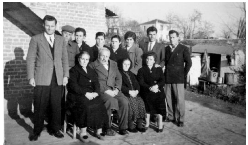
Οικογενειακή φωτογραφία των Λυκιδέων.