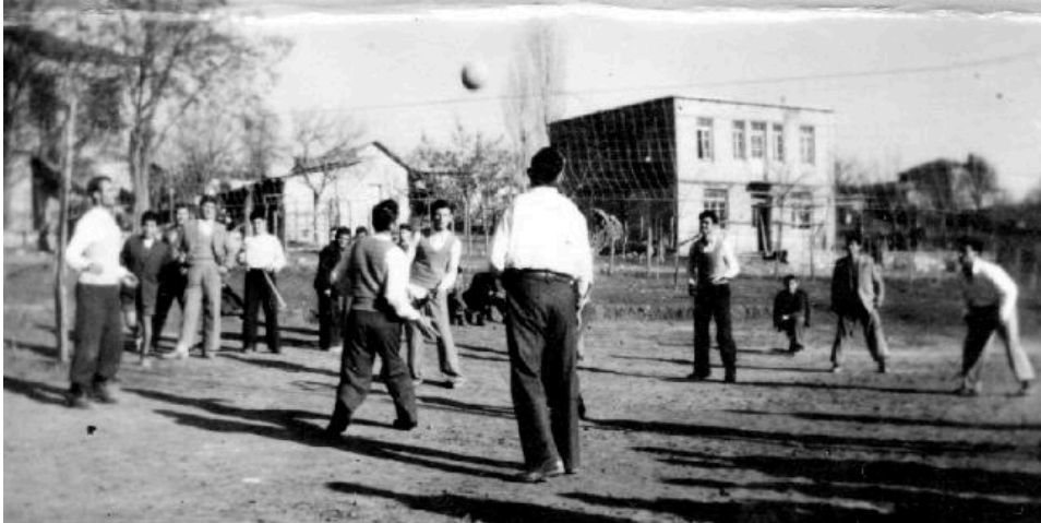
Νέοι του χωριού παίζουν βόλεϋ στην κεντρική πλατεία.

Ταξίδι στο χρόνο μέσα από το πλούσιο φωτογραφικό αρχείο του συλλόγου μας.