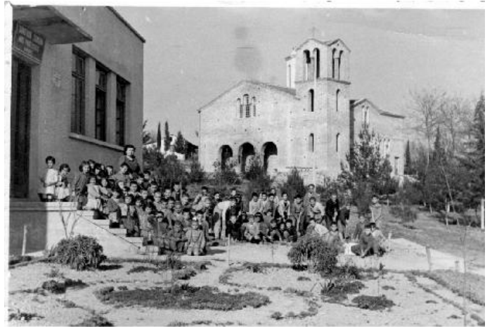
Μαθητές του Δημοτικού Σχολείου Νέας Τραπεζούντας τη δεκαετία του 1950 και πίσω διακρίνεται η νεόκτιστη εκκλησία της Ζωοδόχου Πηγής.