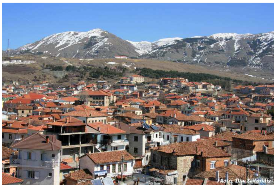
Άποψη της πόλης Κορυτσάς

Στις 9 Σεπτεμβρίου 1906 ο Φώτιος ξεκίνησε για το χωριό Βρατοβίτσα. Το χωριό αυτό το διεκδικούσαν οι Ρουμάνοι και οι Βούλγαροι αλλά μάταια, ο Φώτιος έγκρισε ελληνορθόδοξο ναό και με τους λόγους του κράτησε τους κατοίκους του χωριού στον Ελληνισμό και το Πατριαρχείο. Τον συνοδεύαν ο πρωθιερέας Ιωσήφ, ο διάκος και ο κλητήρας της μητρόπολης. Την άλλη μέρα θά τελούσε τα εγκαίνια του ναού του χωριού, καθώς και τη θεία λειτουργία. Τον είχαν ειδοποιήσει εκείνη τη