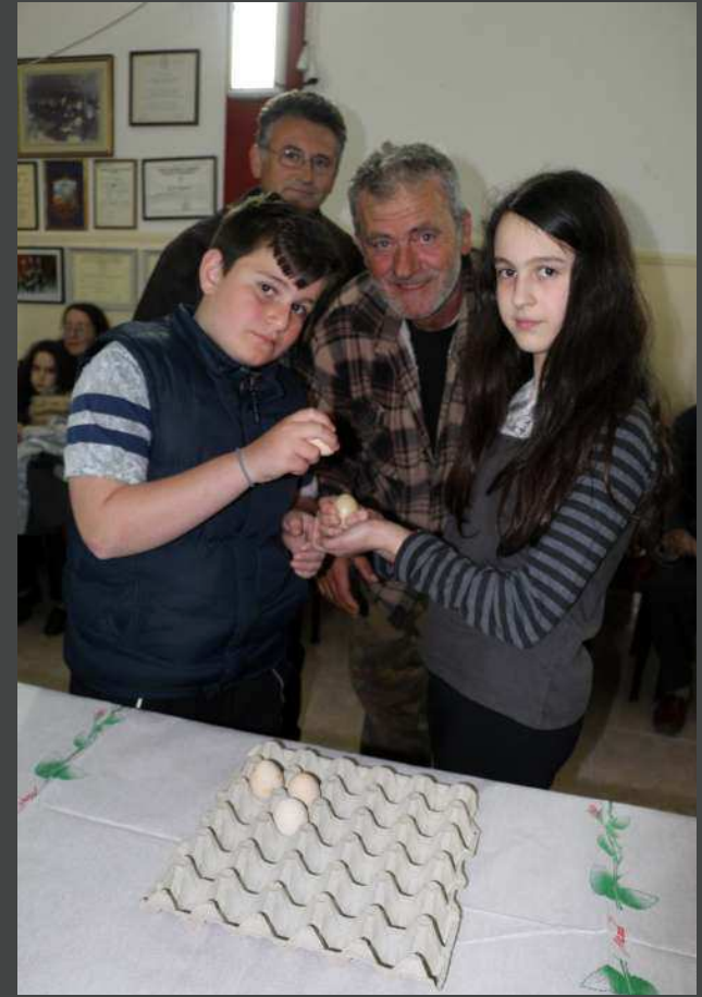
Μικροί αυγομάχοι κατά τη διάρκεια του πσυγκρίσματος των αυγών