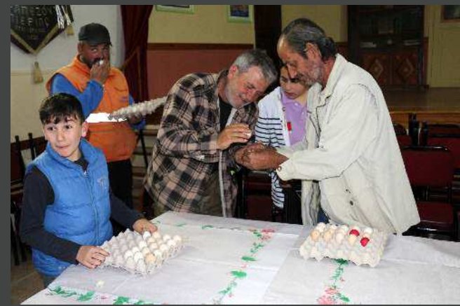
Οι διαγωνιζόμενοι αυγομάχοι στην ομάδα των ενηλίκων