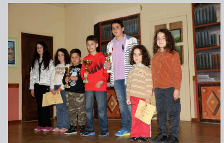
Οι διακριθέντες στις μικρές ηλικίες σε αναμνηστική φωτογραφία