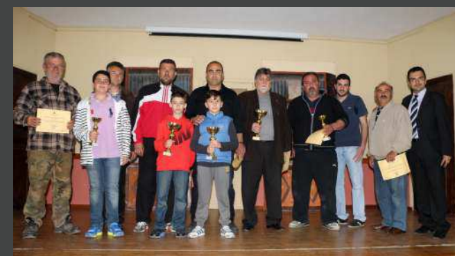
Μικροί και μεγάλοι νικητές σε αναμνηστική φωτογραφία