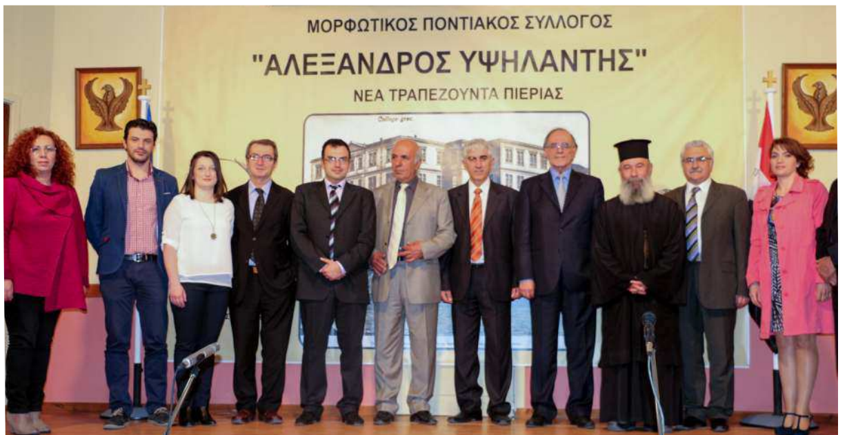
Τα μέλη του Δ.Σ. του Συλλόγου σε αναμνηστική φωτογραφία με τον κ. Γεώργιο Σούρλα τον Σεβαστό Πατέρα Δημήτριο τον κ. Ιωάννη Μεγαλόπουλο και την κ. Ελένη Μεγαλοπούλου

Απονομή του βραβείου Αλέξανδρος Υψηλάντης στον κ. Γεώργιο Σούρλα πρώην Υπουργό και Αντιπρόεδρο της Ελληνικής Βουλής.