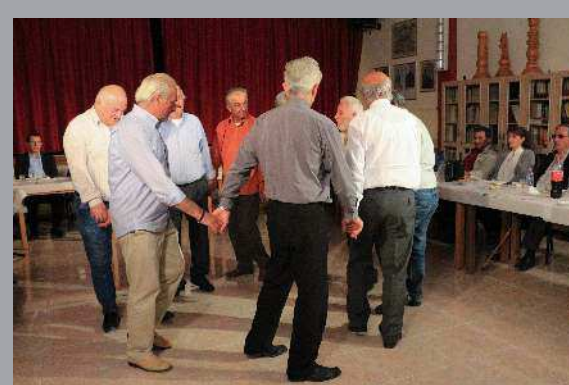
Παλιοί χορευτές του Συλλόγου στον Οφίτικο χορό Λέτσι