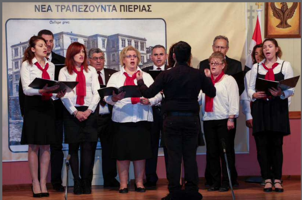
Η χορωδία του Συλλόγου σε τραγούδια του Πόντου