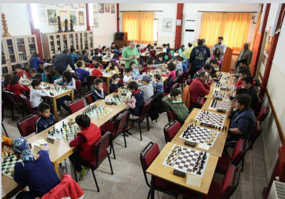
Άποψη απ' την κατάμεστη αίθουσα του Συλλόγου όπου έγινε και το τουρνουά