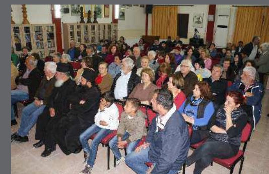
Αποψη του κόσμου που παρευρέθηκε στην έναρξη των εκδηλώσεων