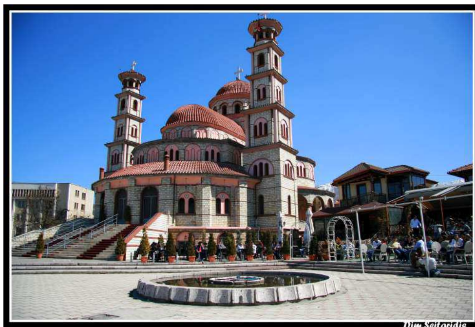
Ο Μητροπολιτικός Ναός του Αγίου Γεωργίου Κορυτσάς

Το 1903 είναι δύσκολη χρονιά για τον Ελληνισμό καθώς ό,τι δεν πέτυχαν οι Βούλγαροι Κομιτατζήδες με την προπαγάνδα και τις δολοπλοκίες τους, το επιχειρούν με τη βία, το τσεκούρι και τη φωτιά. Ο Μακεδονικός Αγώνας μπαίνει στη σκληρότερη και κρισιμότερη φάση του. Οι εμπρησμοί και οι δολοφονίες Ελλήνων και Πατριαρχικών είναι πια στην ημερήσια διάταξη. Και στη φάση αυτή η μόνη ίσως προστασία για τους αδύναμους κι ανυπεράσπιστους ελληνικούς πληθυσμούς είναι το Πατριαρχείο της Κωνσταντινούπολης. Το Φανάρι μέσω του κλήρου προσπαθεί όσο μπορεί κι όπως μπορεί να βοηθήσει τους κατατρεγμένους, να παρηγορήσει, να ενθαρρύνει. Το Πατριαρχείο διαβλέποντας τον κίνδυνο του αφελληνισμού πολλών και μεγάλων επαρχιών του φροντίζει και στέλνει στους επισκοπικούς θρόνους ιεράρχες νέους στην ηλικία και τολμηρούς, α-