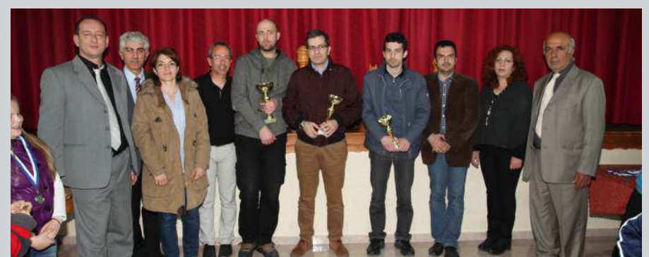
Οι τρεις πρώτοι νικητές σε αναμνηστική φωτογραφία με τα μέλη του Δ.Σ. του Συλλόγου και τον κ. Γκούτζιο Δημήτριο