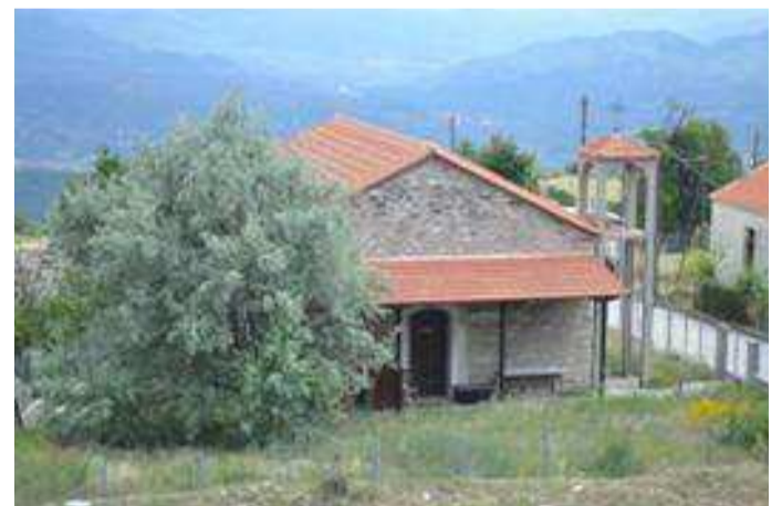
Η Εκκλησία του Αγίου Δημητρίου στο Περίβλεπτο Δράμας