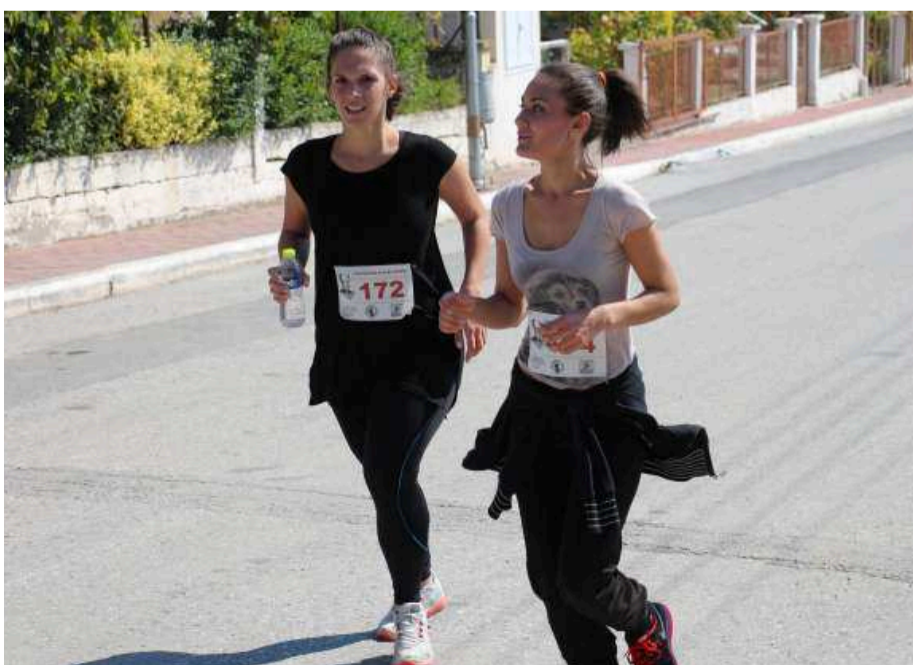
Όμορφες παρουσίες και φέτος, δίνονταν την δική τους μάχη, στον αγώνα δρόμου