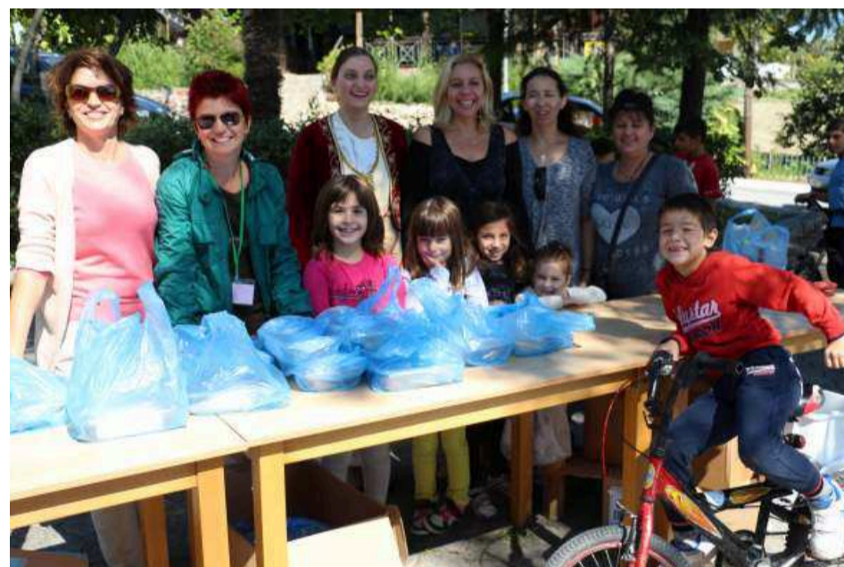
Οι κυρίες του Συλλόγου "Υψηλάντης" ετοίμασαν τα ποντιακά εδέσματα