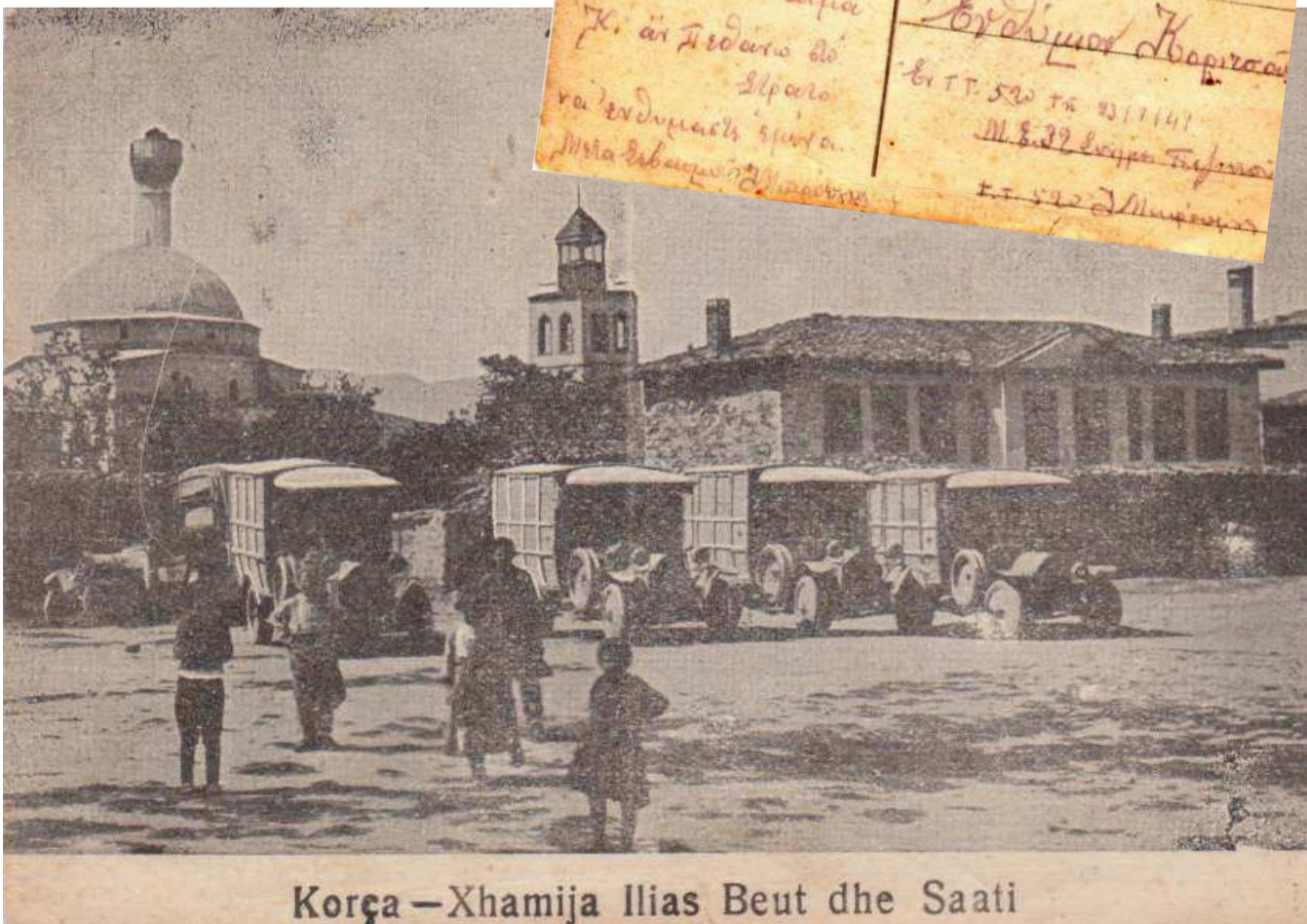
Κορça - Xhamija Ilias Beut dhe Saati