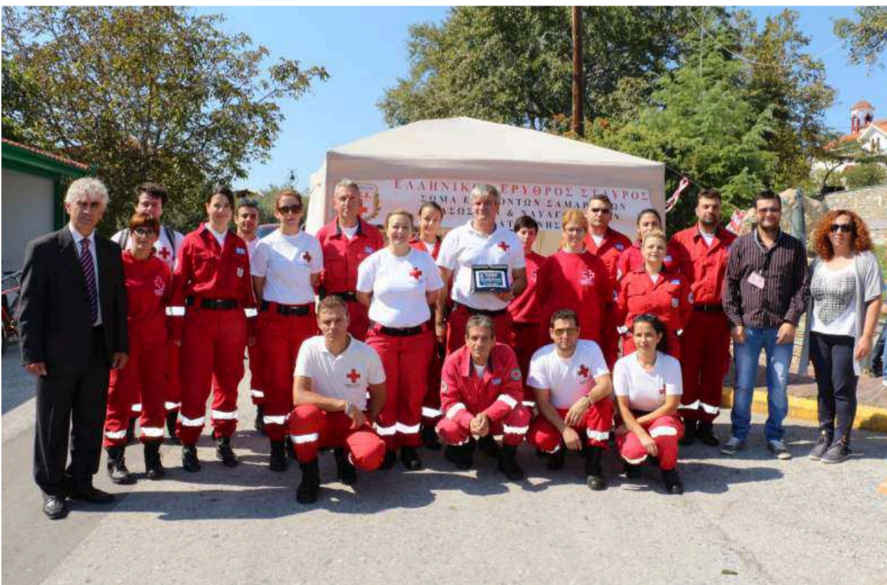
Τα μέλη του Ερυθρού Σταυρού - Περιφερειακό Τμήμα Κατερίνης