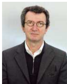
του Γιάννη Μεγαλόπουλου

Συλλογή στοιχείων που προκύπτουν από την μελέτη και αποδελτίωση της Οθωμανικής απογραφής του πληθυσμού της αυτοκρατορίας το 1834.