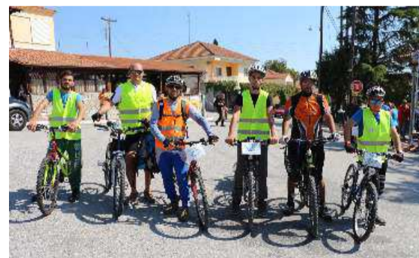
Τα μέλη της "Ποδηλατικής Απόδρασης Κατερίνης"