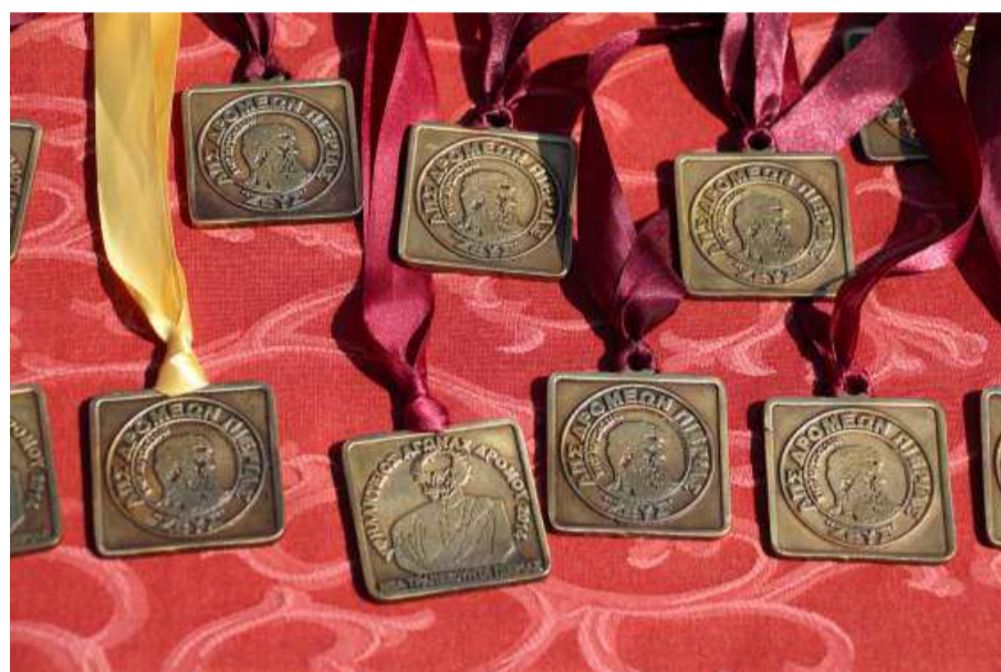
Τα μετάλλια που απονεμήθηκαν σε όλους του δρομείς