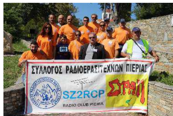
Τα μέλη του συλλόγου "Ραδιοερασιτεχνών Πιερίας"