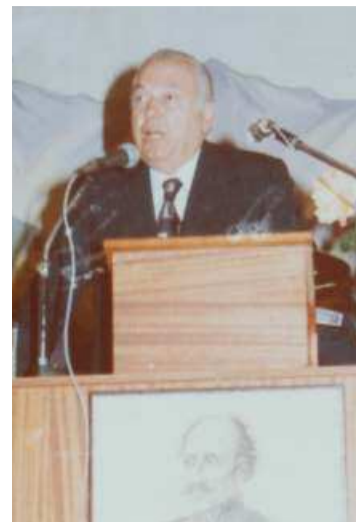
Στην ομιλία του στα Α' Υψηλάντεια το 1983

Σε ηλικία 97 ετών πέθανε στη Βιέννη ο γνωστός καθηγητής κ. Πολυχρόνης Ενεπεκίδης. Γεννημένος στις 12 Ιουνίου 1917 στην Αμισό του Πόντου. Ο Πολυχρόνης Ενεπεκίδης σπούδασε φιλολογία και ιστορία στο Πανεπιστήμιο Αθηνών, για να μετεκπαιδευτεί στα Πανεπιστήμια Παρισιού και Βιέννης όπου αναγορεύτηκε διδάκτορας, αναλαμβάνοντας αργότερα υφηγητής και το 1960 καθηγητής στην έδρα Βυζαντινών και Νεοελληνικών Σπουδών του Πανεπιστημίου Βιέννης, όπου από το 1974 έως το 1992 που συνταξιοδοτήθηκε, προΐστατο του Ινστιτούτου Βυζαντινών Σπουδών.