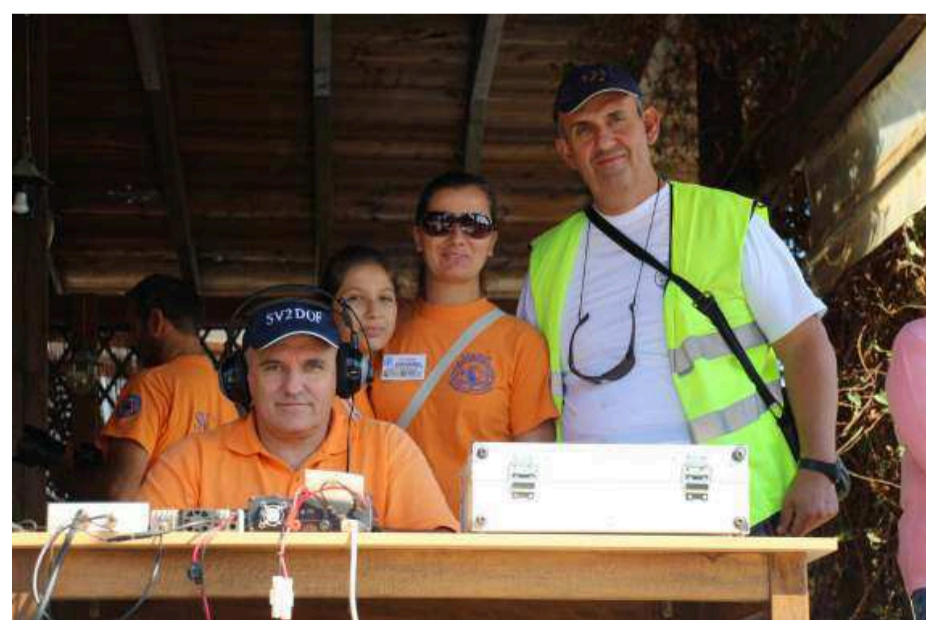
Οι ραδιοερασιτέχνες κάθε χρόνο συμβάλουν με την εθελοντική τους συμμετοχή στην ασφαλέστερη διεξαγωγή του αγώνα