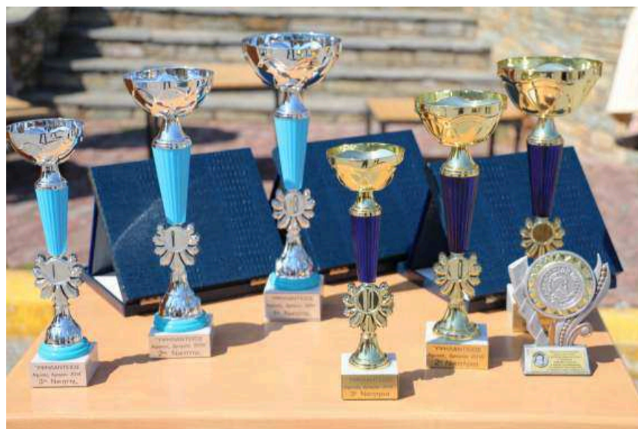
Τα φετινά κύπελλα που απονεμήθηκαν στους νικητές