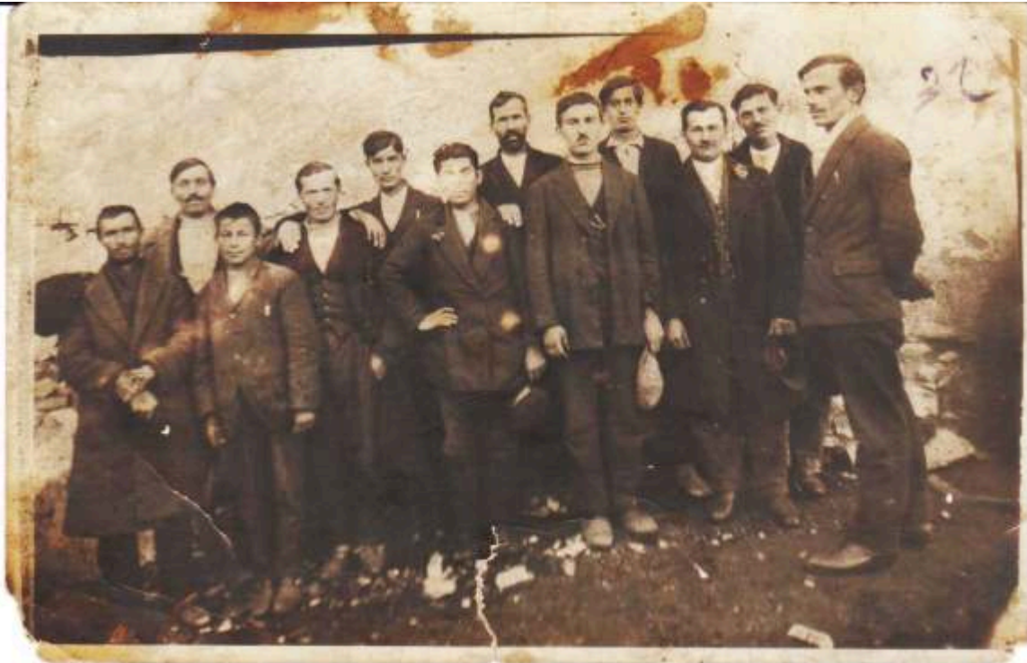
Οφίτες πρώτης γενιάς στο Περιβλεπτον Δράμας σε αναμνηστική φωτογραφία τη δεκαετία του 1920.

Ταξίδι στο χρόνο μέσα από το πλούσιο φωτογραφικό αρχείο του συλλόγου μας.