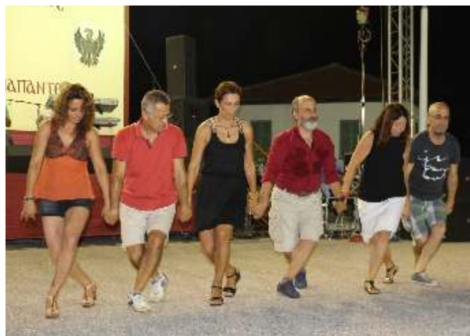
Η χορευτική ομάδα από την Κωνσταντινούπολη στο χορό άσα' πατ.