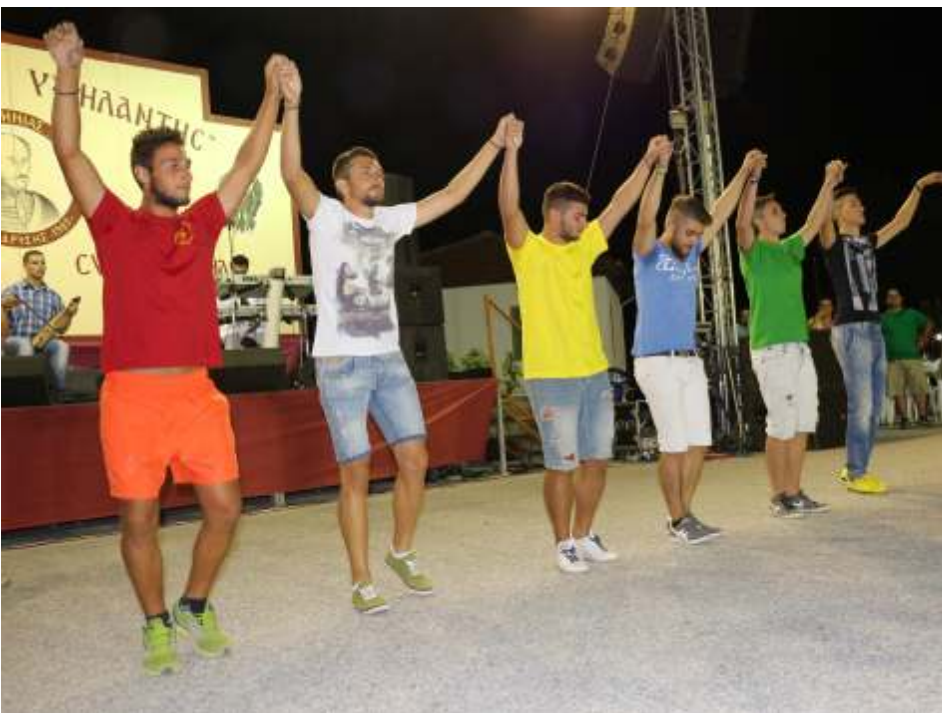
Η νεοί του συλλόγου μας στο χορό «ΣΕΡΑ».

Από το Διοικητικό Συμβούλιο του Συλλόγου «Αλέξανδρος Ψηλάντης» Νέας Τραπεζούντας.