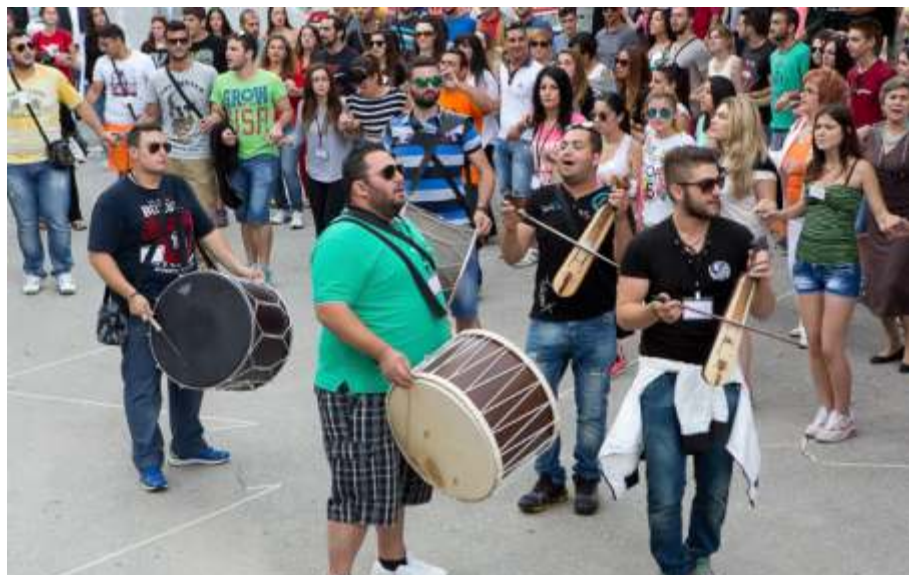
Οι νεολαίοι στον αποχαιρετιστήριο χορό μπροστά στον Ιερό Ναό της Παναγίας Σουμελά.

Όταν η αγάπη για την παράδοση, την πίστη και τις αξέχαστες πατρίδες γίνεται, μέσω της γνώσης και της μνήμης, τρόπος ζωής. Το όνομα της Παναγίας Σουμελά γράφανε με τα σώματά τους οι περίπου 600 νέοι. Η από αέρος φωτογραφία τα λείει όλα. Δύο αγαπημένες λέξεις, που με την αγάπη των νέων γίνονται χίλιες λέξεις, χίλιες σκέψεις και χίλιες αναμνήσεις...!