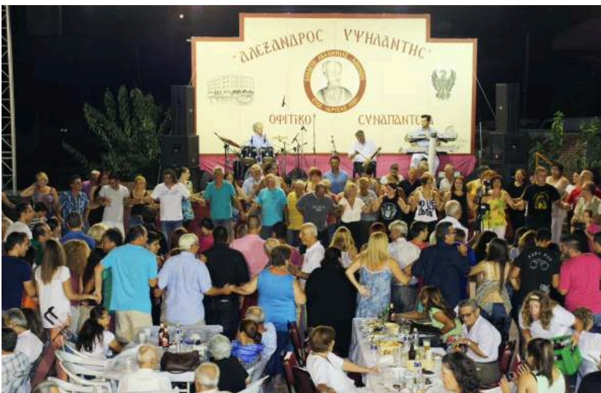
Μερική άποψη του κόσμου από την μεγάλη συμμετοχή του κόσμου.