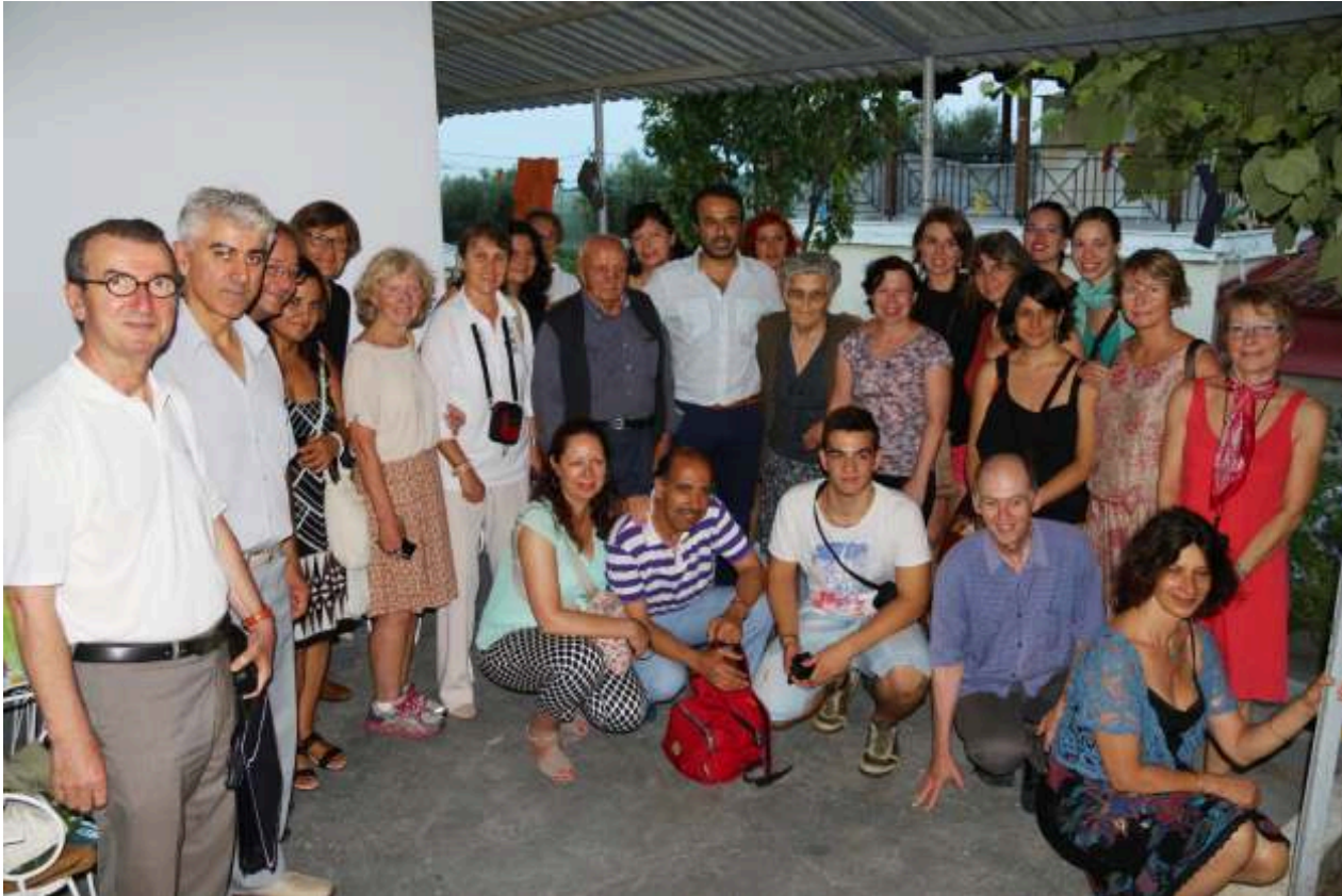
Καθηγητές χορού και μέλη του συλλόγου σε αναμνηστική φωτογραφία.