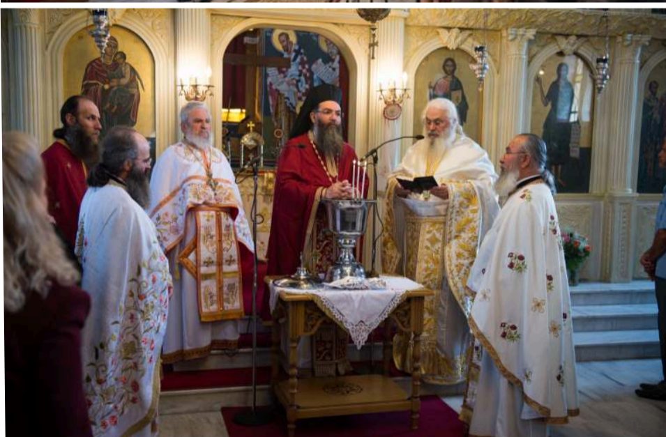
Πανηγυρική Θεία Λειτουργία την ημέρα της εορτής της Ζωοδόχου Πηγής

δώ και πολλά χρόνια αναβιώνει στην Νέα Τραπεζούντα το Ταφικό Έθιμο όπως γίνονταν στον ιστορικό Όφι του Πόντου. Έτσι και φέτος οι απαπταχού Οφίτες συγκεντρώθηκαν στα κοιμητήρια του χωριού μας για να τιμήσουν την μνήμη των κεκοιμημένων συγγενικών προσώπων, όπου μετά την Θεία Λειτουργία στον Απόστολο Θωμά έγινε επιμνημόσυνη δέηση σε κάθε μνήμα ξεχωριστά από τον π. Δημήτριο.