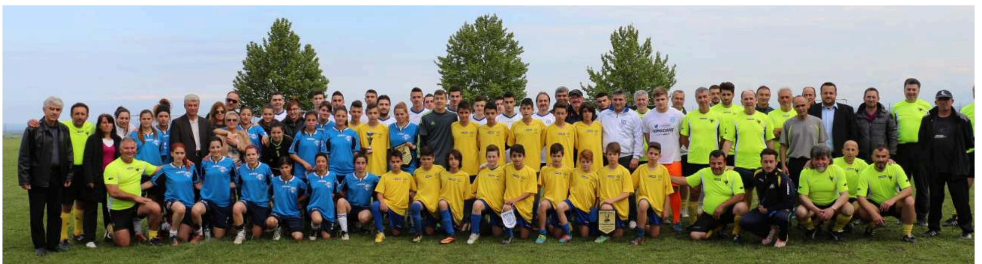
Ποδοσφαιρικές αγώνες για φιλανθρωπικό σκοπό από τις ομάδες "Νεφέλες Κατερίνης", παιδική ομάδα της ΠΑΕ Ποντίων Κατερίνης, και παλαιμάχων Πιερίας και Εθνικού Ν. Τραπεζούντας