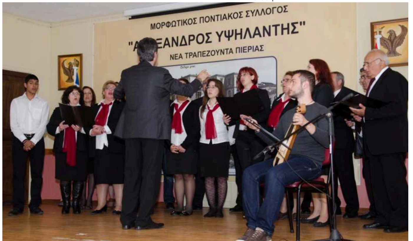
Η χορωδία του Συλλόγου μας σε παραδοσιακά ποντιακά τραγούδια