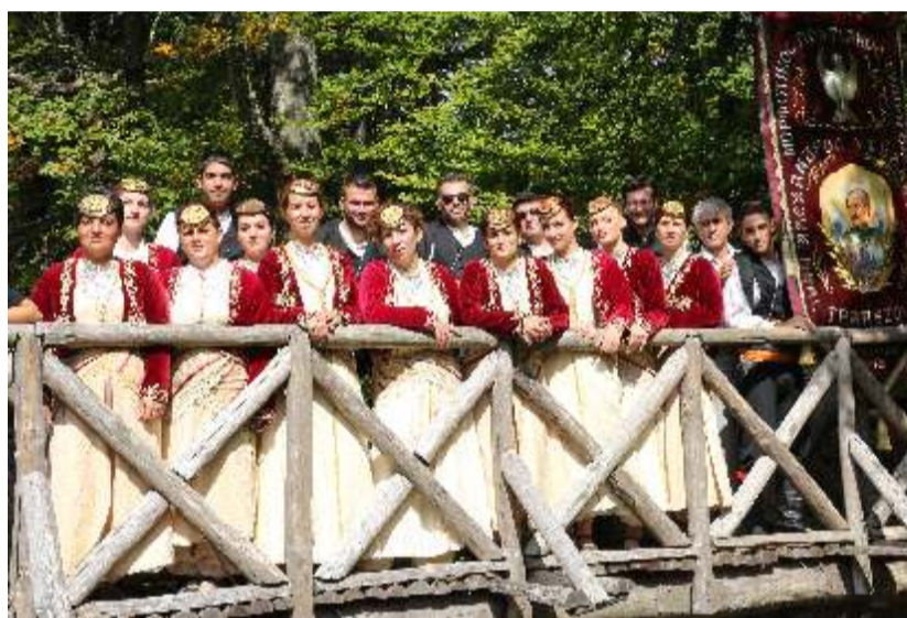
Η χορευτική ομάδα σε αναμνηστική φωτογραφία