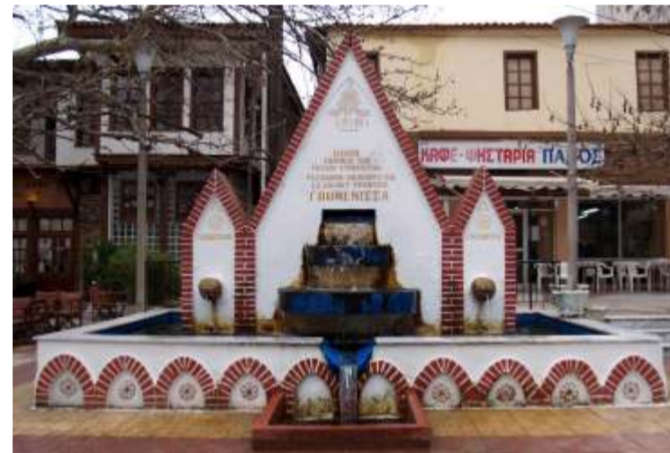
Η κεντρική πλατεία της Γουμένισσας