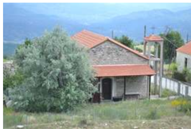
Ο Ι.Ν. Αγίου Δημητρίου

Όταν οι παππούδες μας αφίχθησαν στο χωριό διαπίστωσαν ότι σε πολλά σπίτια κατοικούσαν ήδη