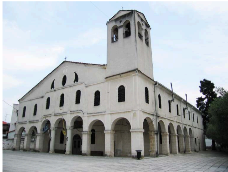
Το ξακουστό Μοναστήρι της Παναγίας της «Γουμένισσας»

Ο Αρριανός, ο βιογράφος-ιστορικός του Μεγάλου Αλεξάνδρου μας δίνει επίσης πολλά στοιχεία