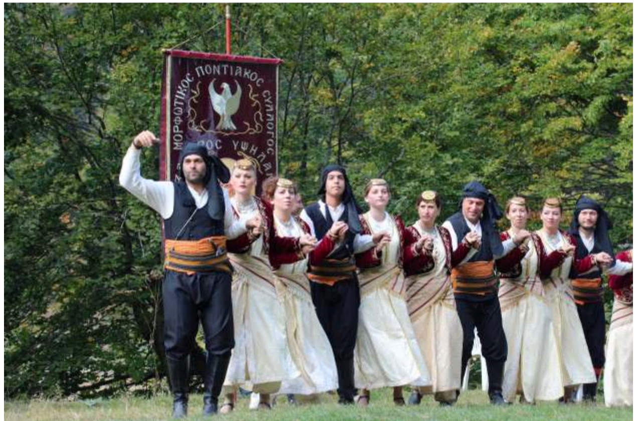
Η χορευτική ομάδα του συλλόγου μας ξεκινά με τον χορό "Εμπρο Πις"

Από το 1878 η κατάσταση χειροτερεύει. Από την πανσλαβιστική προπαγάνδα καταβάλλεται προσπάθεια αλλοίωσης του ελληνικού εθνικού χαρακτήρα των κατοίκων της περιοχής. Η προπαγάνδα χρησιμο-