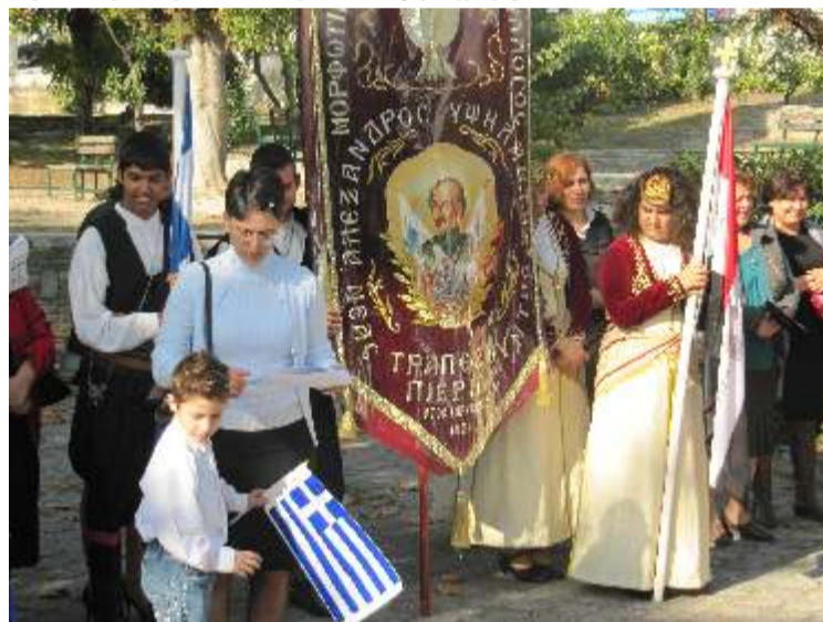
Τα παιδιά του χορευτικού με το λάβαιο του συλλόγου