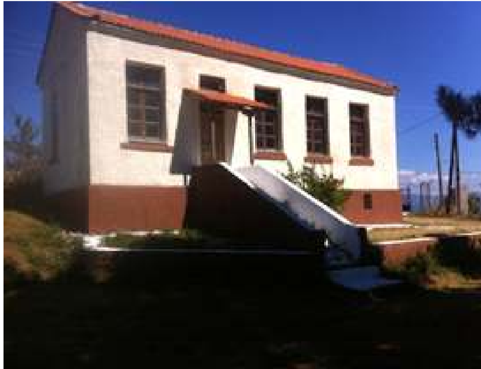
Το Δημοτικό Σχολείο Περιβλέπτου όπως είναι σήμερα

τους βοηθήσουμε. Γι αυτό, τουλάχιστο μια φορά τον χρόνο στις εορταστικές εκδηλώσεις του χωριού του Αγίου Δημητρίου, να καταβάλλουμε κάθε δυνατή προσπάθεια για να παραβρεθούμε στις εκδηλώσεις αυτές που προετοιμάζει ο Σύλλογος.