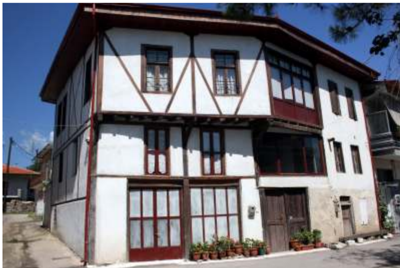
Παλιό αρχοντικό της Γουμένισσας