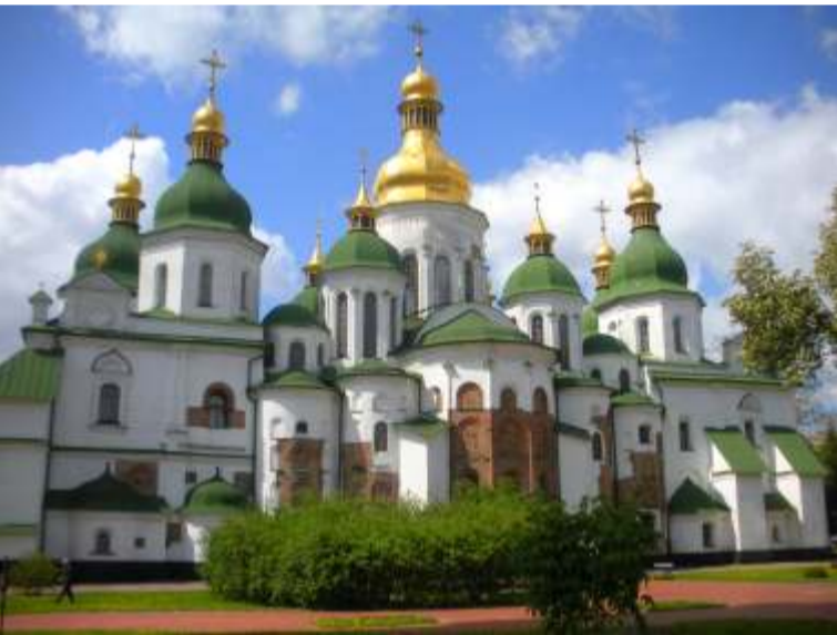
Η εκκλησία της Αγίας Σοφίας Κιέβου

Οι Ρώσοι ήταν ένα σλάβικο έθνος, υποταγμένο τότε σε μία μικρή πολεμοχαρή σκανδιναβική φυλή, τους – Βαράγγους - , που είχαν κατέβει από την λίμνη Λάδογα. Αν και Σλάβοι αυτοί ήταν υποτελείς στους Βαράγγους, η γλώσσα τους επεκράτησε και τελικά οι Βαράγγοι, που ονομάζονταν επίσης Ρως, αφομοιώθηκαν με αυτούς, αλλά έδωσαν το όνομα τους: Ρως, Ρώσοι.