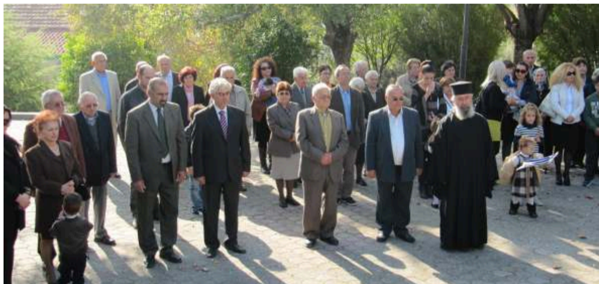
Αποψη του κόσμου στην πλατεία του χωριού μας