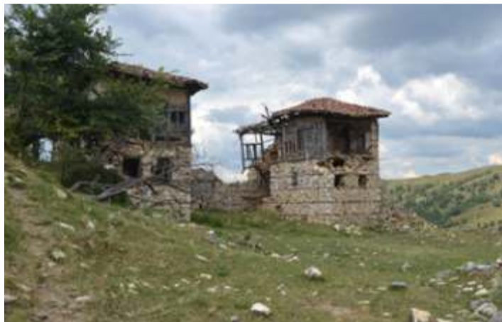
Δύο αρχοντικά που σώζονται μέχρι σήμερα

τους βοηθήσουμε. Γι αυτό, τουλάχιστο μια φορά τον χρόνο στις εορταστικές εκδηλώσεις του χωριού του Αγίου Δημητρίου, να καταβάλλουμε κάθε δυνατή προσπάθεια για να παραβρεθούμε στις εκδηλώσεις αυτές που προετοιμάζει ο Σύλλογος.