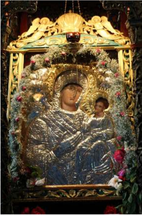
Συνέχεια από τη σελ. 1

Εκεί μας υποδέχθηκε ο Ιερομόναχος της μοναχικής αδελφότητας ο οποίος μας ενημέρωσε για την ιστορία του ναού και της θαυματουργής εικόνας.