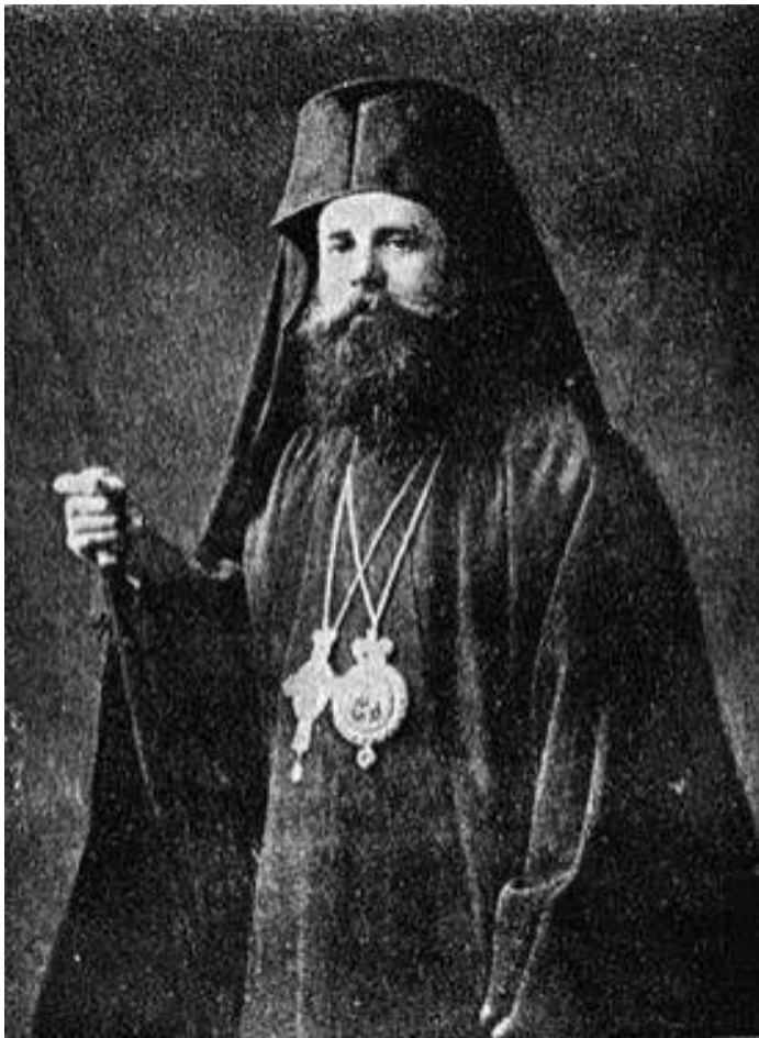
Ο τελευταίος Μητροπολίτης Τραπεζούντος και μετέπειτα Αρχιεπίσκοπος Αθηνών, Χρυσάνθος Φιλιππίδης