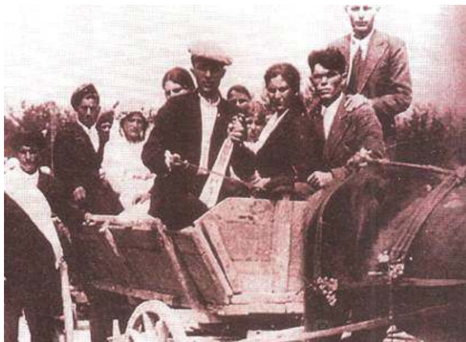
Το πάρσιμο της νύφης, «το νυφόπαρμα», έθιμο του ποντιακού γάμου

Για τους Θρακιώτες πρόσφυγες της Πιερίας μια πρώτη σειρά αφηγήσεων έ-