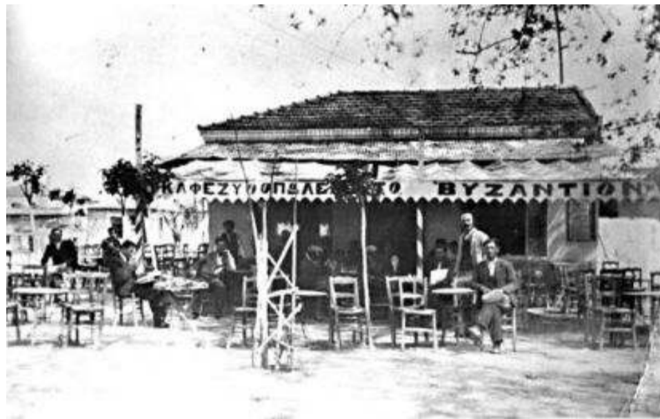
Το καφενείο "Βυζάντιον" την δεκαετία του '30