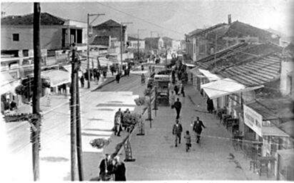
Η οδός Μ. Αλεξάνδρου την δεκαετία του '30

1985) στα «Απομνημονεύματα» (Κατερίνη 1965) μάς παρέχει πληροφορίες γύρω από τους κεμαλικούς διωγμούς, τις προσπάθειες εγκατάστασης στην Ελλάδα στην Κατερίνη του μεσοπολέμου («ελώδης χωρίς πόσιμο νερό») και στη γενεαλογία του γράφοντος. Στην πρώτη σελίδα και ο υπέρπιλος: «Πόντος» με τον προσδιορισμό του θέματος: «Απομνημονεύματα από την εξόντωση και σφαγή του ποντιακού ελληνισμού υπό της επαναστατικής κυβερνήσεως του Κεμάλ, και ο επαναπατρισμός εις την Ελλάδα». Στον πρόλογό του τονίζει: «Αγαπητοί μου αναγνώσται, δεν γράφω φαντασίες ή υπερβολές, αλλά απτά και συγκεκριμένα όπως τα έζησα και υπόφερα πριν σαράντα επτά