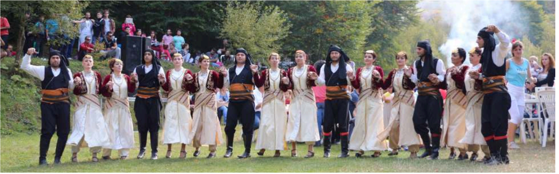
Το χορευτικό τμήμα του συλλόγου μας στο χώρο των εκδηλώσεων

για τη συμμετοχή των Παιόνων, ως επίλεκτου σώματος του Μακεδονικού Στρατού που συνέβαλε στην πορεία του Μεγάλου Αλεξάνδρου προς την Ανατολή. Στα ελληνιστικά και τα ρωμαϊκά χρόνια η Παιανία και οι πόλεις της (Στοβοί, Βυλάζωρα, Αντιγόνηα, Ιωρο, Δόβηρος, Εύρωπος, Γορτυνία, Αταλάντη και Ειδομένη) συνεχίζουν τη δυναμική τους παρουσία, ώσπου στο τέλος καταντούν ρωμαϊκή επαρχία.